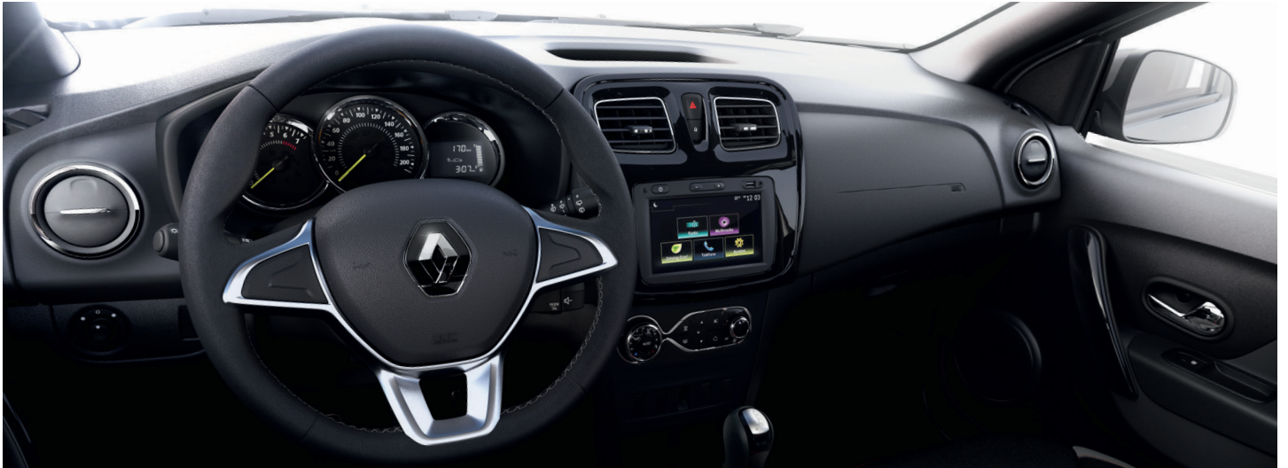
intens MT y CVT